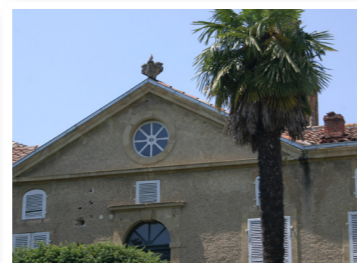
Des réemplois cocasses !

Face à la rue des Platanes, la statue en bois de la Sainte-Barbe (placée dans le mur) la patronne des pompiers et «faiseuse d'orage»