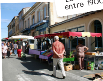
Le marché du mercredi