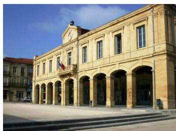
Le cœur de ville