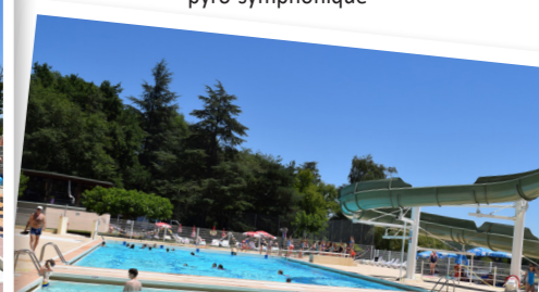
Idéal pour les vacances en famille !

L'après-midi, on suit le sentier de randonnée, ensuite on traverse le lac en pédalo*, on descend à toute vitesse le toboggan de la piscine puis on se défie au mini-golf.