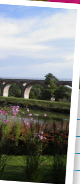
Le viaduc à 8 arches du lac