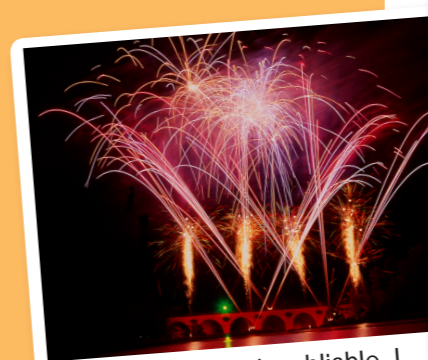
Un spectacle inoubliable !