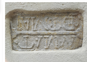
Des inscriptions énigmatiques

Rue des Platanes, dans le renforcement d'une bâtisse, se cache un fragment de pierre aux inscriptions latines difficilement déchiffrables. Elle daterait de la création de Bologna.