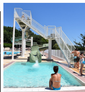
La piscine d'été

C'est le lieu idéal d'une journée parfaite en famille ou entre amis. Une canne à pêche en place, un pique-nique au bord de l'eau à l'ombre des arbres ou un repas à la terrasse du restaurant, des enfants qui profitent de l'aire de jeux... Détendez-vous !