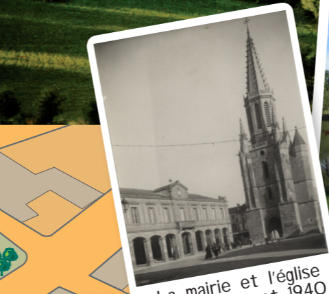
La mairie et l'église entre 1900 et 1940