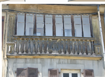
Une architecture typique